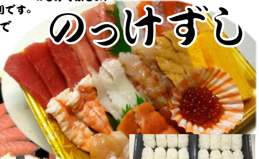
お届けはこのスタイルでお届けします